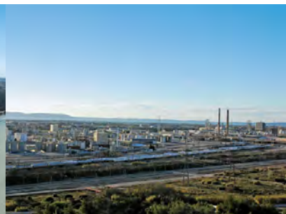
Bonnet Lyondellbasell