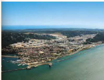
La Mède